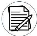
สมุดยึดทรัพย์สินของกลาง