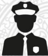
หัวหน้าสถานีตำรวจ