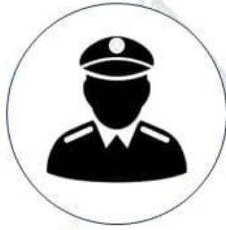
พนักงานสอบสวน